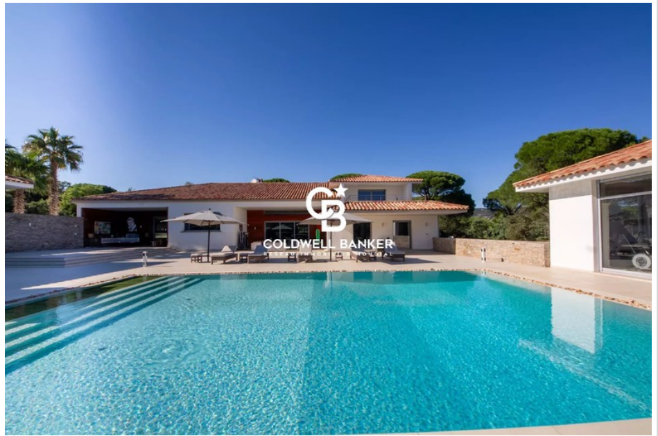
Villa Le Plan-de-la-Tour